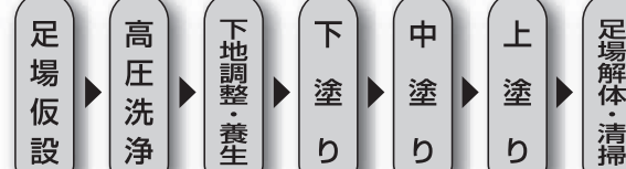
〈外部塗装工事の流れ〉